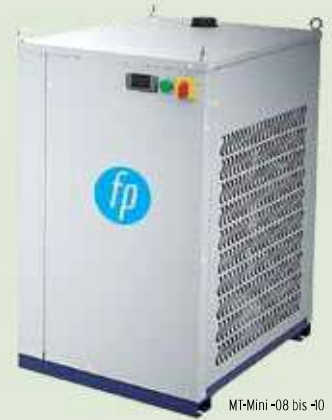
MT-Mini-08 bis -10