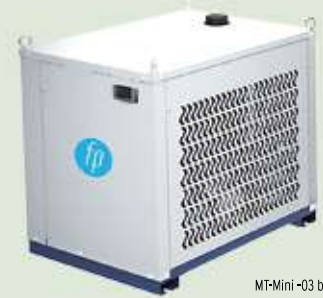
MT-Mini -03 bis -05